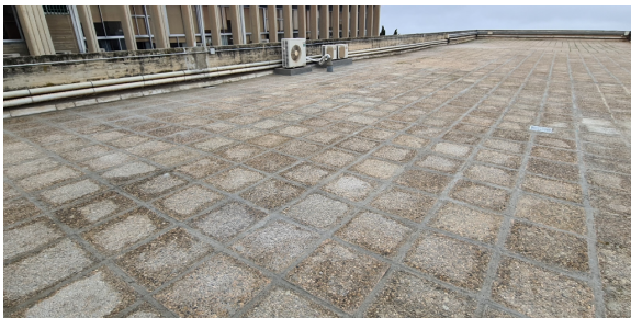
Zona de reparación de goteras, sobre Conserjería y pasillo de Informática II

Aunque no está en marcha un proyecto integral de renovación de las cubiertas como se proponía en la memoria de gestión de 2022, se llegó a un acuerdo con la Unidad Técnica para arreglar diversas zonas de la cubierta que ocasionaron goteras en las zonas de Conserjería, Informática II y cubierta sobre la escalera desde el Auditorio I hacia Eslava.