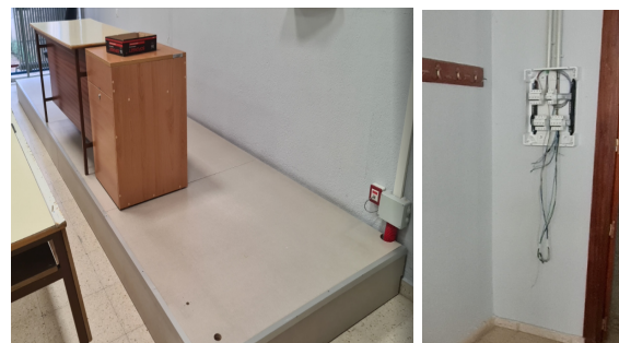
La integración de cableado y conexiones junto a mesa de docencia requiere nuevo cuadro eléctrico.

Se está intentando ampliar, en todos los espacios donde es posible, la zona de tarima para facilitar acceso a personas con dificultades de movilidad, reubicando medios y otros elementos junto a la mesa de docencia. Se han instalado nuevos elementos de megafonía (amplificador, 2-3 parejas de altavoces y nuevo cableado) en todas las aulas renovadas con cargo al programa de docencia práctica. Progresivamente, se van eliminando los armarios de medios colocados sobre pupitres, sin fijación alguna.