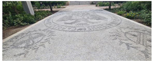
Zona de entrada con escudo limpiada y consolidada

Han continuado las tareas de limpieza, renovación y mantenimiento de los espacios comunes del centro. Las actuaciones incluyen la limpieza y reparación de las escaleras de acceso al jardín y al edificio principal desde la parada de autobús frente a Económicas, consolidación y limpieza del escudo en el patio, pintura de rejas, paredes de pasillos, paredes en algunas zonas de la planta baja de la biblioteca y aulas en las que la reordenación del cableado dejó elementos sin pintar.