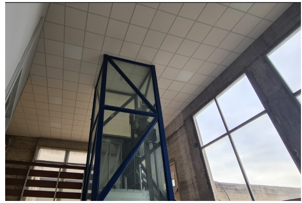
Actuaciones en falso techo y luminarias de la zona de acceso al dpto. de Eslava

En la zona entre la terraza y la puerta de acceso al dpto. de Eslava se ha reparado y limpiado la cubierta que ocasiona goteras. También se ha sustituido el falso techo deteriorado (con nueva estructura metálica, planchas y luminarias), puesto que las malas condiciones del techo daban una impresión de deterioro que contrastaba con la estética de la zona reformada a la que se accede desde la parte superior de escaleras y ascensor.