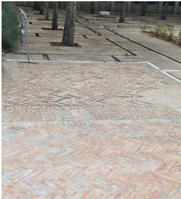
Zona con cuadrículas de ladrillo rehechas