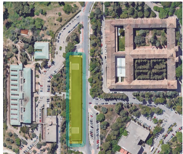
Ubicación prevista del nuevo Aulario de Cartuja

Entre otros detalles, se han ido concretando los criterios para acometer las distintas fases del Plan Director de la Facultad de Filosofía y Letras , revisado para facilitar la integración de la actividad de todas las titulaciones del centro en el edificio principal, Observatorio, edif. departamental y el nuevo aulario . El proyecto de este último se ha presentado ya a la Delegación Territorial de Cultura para su aprobación y este decanato ha recibido copia de la solicitud dirigida a la Junta el 12/12/2023 (Nº 2023999014895941), con estudio de impacto visual asociado.