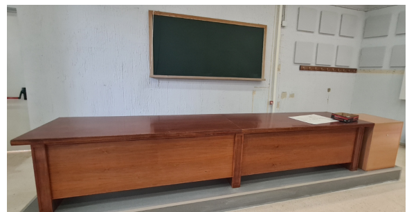
Adaptación de tarima en Auditorio II

Ha continuado la adaptación de tarimas para la integración de medios y conexiones junto a la mesa de docencia, en las aulas de mayor tamaño que no pudo acondicionar el personal del campus en febrero y julio.