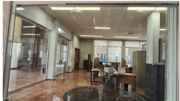
Nueva cristalera en zona de Secretaría

La zona de Secretaría dispone ahora de una nueva cristalera que da un aspecto más diáfano y acogedor al espacio de trabajo.