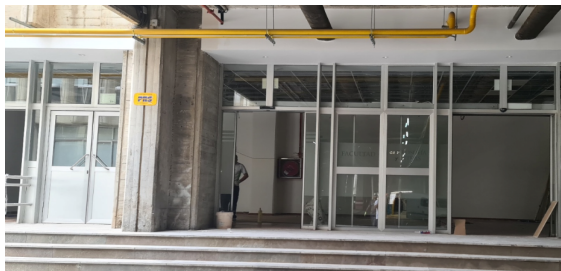
Techo reparado en la salida al aparcamiento

Aunque las obras necesarias comenzaron en el verano de 2022, la nueva caldera de calefacción no pudo entrar en funcionamiento hasta mitad del invierno, condicionando de modo importante la actividad lectiva y administrativa en el centro. Es preciso agradecer a todos los colectivos del centro su comprensión y paciencia en la época de temperaturas más bajas.