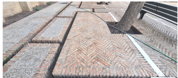
Limpieza y restauración de bloques de ladrillo deteriorados en el jardín

Se ha continuado con la pintura y remodelación de diversos elementos en los baños, incluyendo la reparación de zonas con humedad y losetas deterioradas en el pasillo de entrada al aula García Lorca.