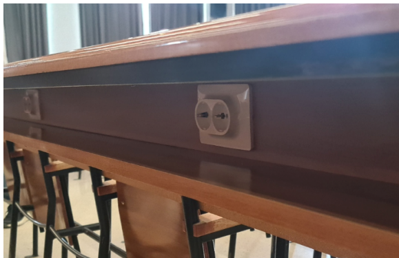
Disposición de enchufes en bancadas del Auditorio II

En los auditorios, así como en otras cinco aulas, se han reparado los asientos rotos y deteriorados; pero solo se ha podido electrificar un tercio de los puestos (bloque de asientos en la grada junto a la pared de entrada, en el auditorio II).