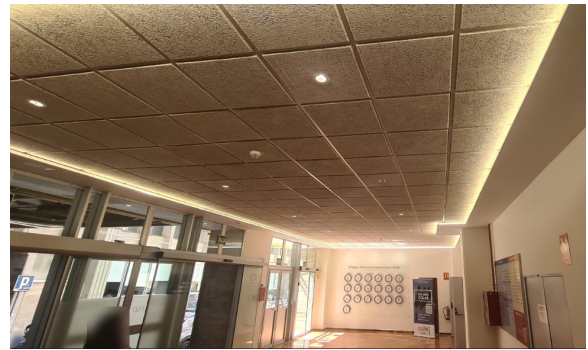
Actuaciones en falso techo de la entrada

Por su elevado coste, el proyecto de reasfaltado, reposición/nivelación de arquetas y señalización del parking queda pospuesto para 2024.