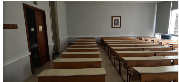
Electrificación con faja de enchufes en pared de obra

Se está intentando ampliar, en todos los espacios donde es posible, la zona de tarima para facilitar acceso a personas con dificultades de movilidad, reubicando medios y otros elementos junto a la mesa de docencia. Se han instalado nuevos elementos de megafonía (amplificador, 2-3 parejas de altavoces y nuevo cableado) en todas las aulas renovadas con cargo al programa de docencia práctica. Progresivamente, se van eliminando los armarios de medios colocados sobre pupitres, sin fijación alguna.