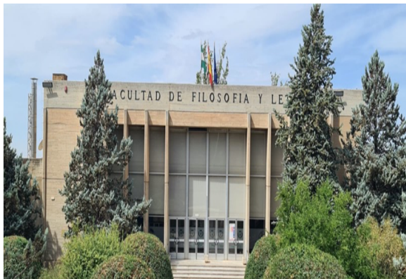
Limpieza de la fachada y cambio de letras deterioradas

De otra parte, se han acometido varias tareas para la limpieza, renovación y mantenimiento de los espacios comunes del centro, tales como: fachada del edificio principal, pintura de rejas, paredes de pasillos, aulas, secretaría y decanato. También se ha continuado con el montaje de estores y remodelación y pintura de puertas y baños.