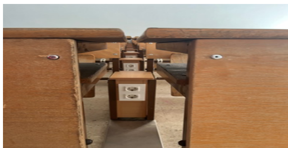
Electrificación en aulas grandes