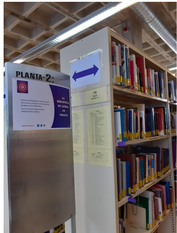
Señalización para el Día de la Mujer

Para destacar los fondos bibliográficos cuya temática trata de la mujer y su situación (desde el punto de vista histórico, artístico, literario, etc.) se realizó una señalización específica en las salas de libre acceso de la biblioteca.