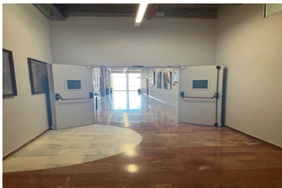
Limpieza, pintura de paredes y puertas de zonas comunes

Se han habilitado nuevos espacios como la sala de profesorado (que se ha remodelado y volcado cada uno de los 12 puestos en SUCRE para facilitar la reserva del PDI); el aula 61 (zona de Historia del Arte y Antropología) con una capacidad máxima de 70 puestos, según la Unidad Técnica. En lugar de proyector tiene también TV de 75" sobre soporte de ruedas y mini PC con Windows 11. Se colocaron estores para reducir la insolación directa y la sobreiluminación.