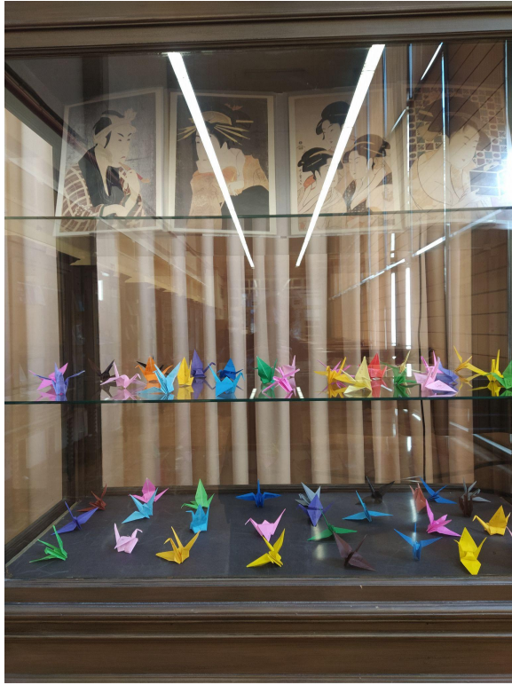
Detalle de la exposición sobre la enseñanza de la lengua japonesa

Aniversario de la Enseñanza de la Lengua Japonesa en la Universidad de Granada.