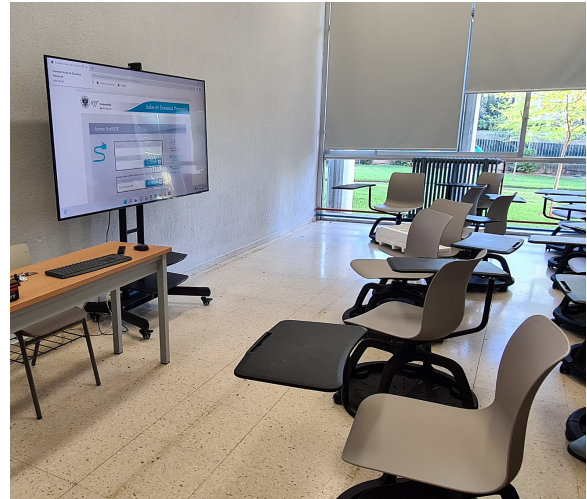
Cambio de la zona de proyección y mobiliario en aula 17

inadecuada que supone tener un espacio muy reducido para la mesa de docencia, entre la puerta y delante de la pizarra o pantalla de proyección. El factor limitante de las actuaciones es el coste del mobiliario, puesto que no hay partidas extraordinarias ni subvenciones para su adquisición o renovación y dependen en exclusiva del presupuesto del Centro.