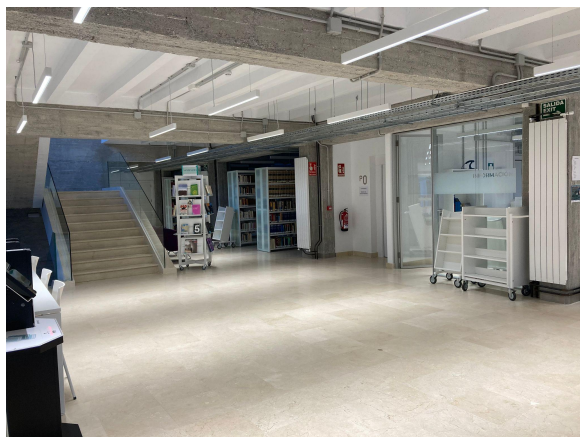
Entrada al nuevo edificio de Biblioteca

Hay que destacar que durante este año se ha podido completar la ampliación de la biblioteca con la puesta a disposición de la comunidad universitaria de un nuevo espacio que amplía en más de 1.400 m2 la superficie de esta biblioteca. Esta mejora es resultado de un gran esfuerzo por parte de biblioteca y facultad para solventar el problema de falta de espacio que venía mermando el desarrollo de la colección bibliográfica y afectando al servicio que prestaba esta biblioteca.