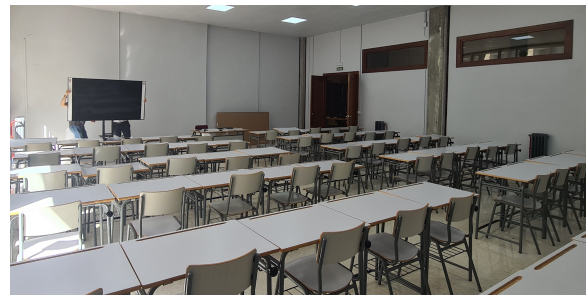
Zona de proyección y mobiliario en aula 61.

Se han habilitado nuevos espacios como la sala de profesorado (que se ha remodelado y volcado cada uno de los 12 puestos en SUCRE para facilitar la reserva del PDI); el aula 61 (zona de Historia del Arte y Antropología) con una capacidad máxima de 70 puestos, según la Unidad Técnica. En lugar de proyector tiene también TV de 75" sobre soporte de ruedas y mini PC con Windows 11. Se colocaron estores para reducir la insolación directa y la sobreiluminación.