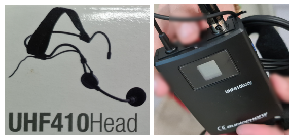
Amplificador, receptor y micrófono de diadema

Para poner solución a las malas condiciones acústicas de muchas aulas (por aislamiento