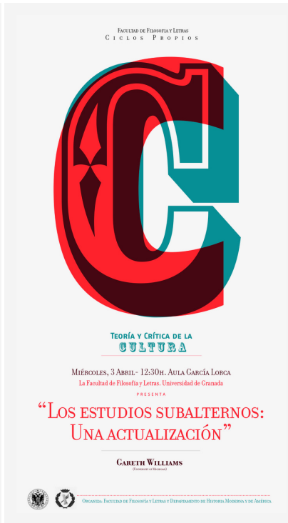
"Los estudios subalternos: Una actualización" por Gareth Williams