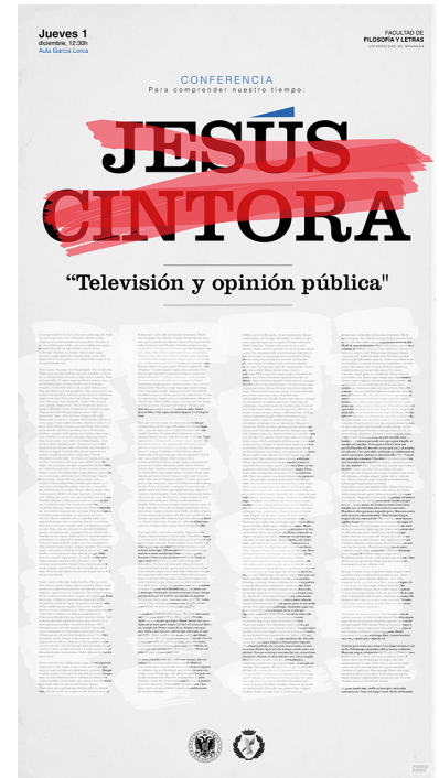
"Televisión y opinión pública" por Jesús Cintora