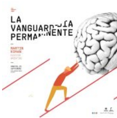
"La vanguardia permanente" por Martín Kohan