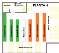
Planta -2 - Biblioteca Facultad de Filosofía y Letras

En la sala inferior se ubican las monografías de Libre Acceso: de Geografía, Cine, Teatro y Música , dividida a su vez en tres subsecciones