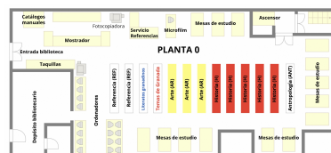
Planta 0 - Biblioteca Facultad de Filosofía y Letras

A la entrada de esta planta se encuentran los catálogos manuales y las taquillas para que los usuarios depositen sus objetos personales. A continuación encontramos el mostrador de atención a los usuarios, el detector antihurto y una zona de reprografía