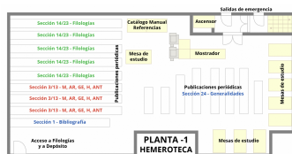
Planta -1 Hemeroteca - Biblioteca Facultad de Filosofía y Letras