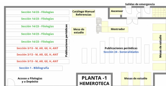
Planta -1 Hemeroteca - Biblioteca Facultad de Filosofía y Letras